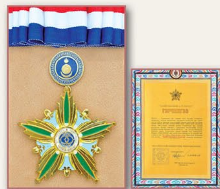
友谊金星勋章和证书（蒙古） 2007年2月13日