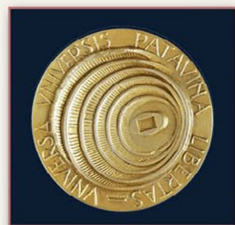
帕多瓦大学金质奖章（意大利） 1987年7月30日