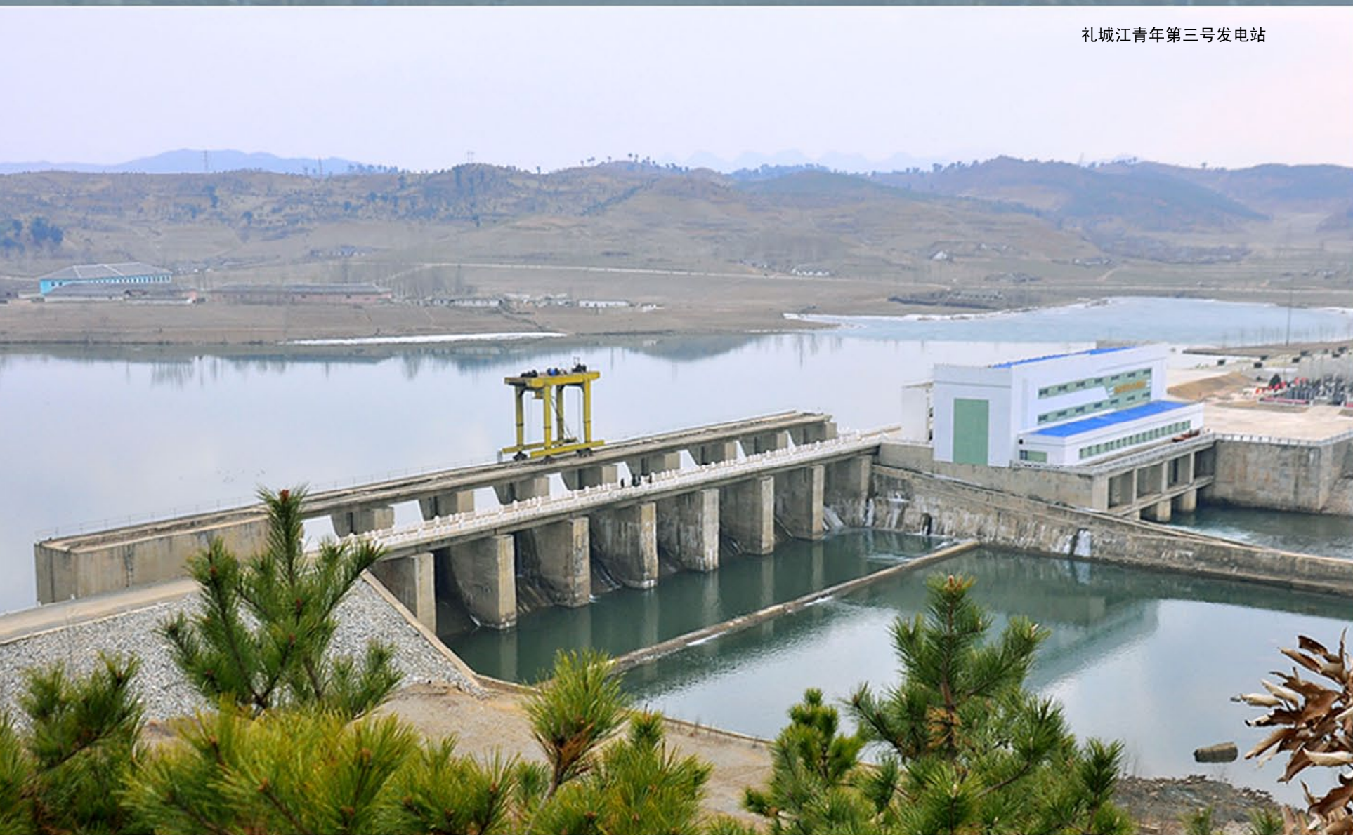
礼城江青年第三号发电站