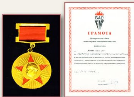
反法西斯同盟奖章和奖状（保加利亚） 2002年2月5日