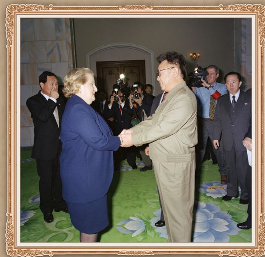
伟大领导者金正日同志会见美利坚合众国国务卿麦得列因·奥尔布赖特。2000年10月