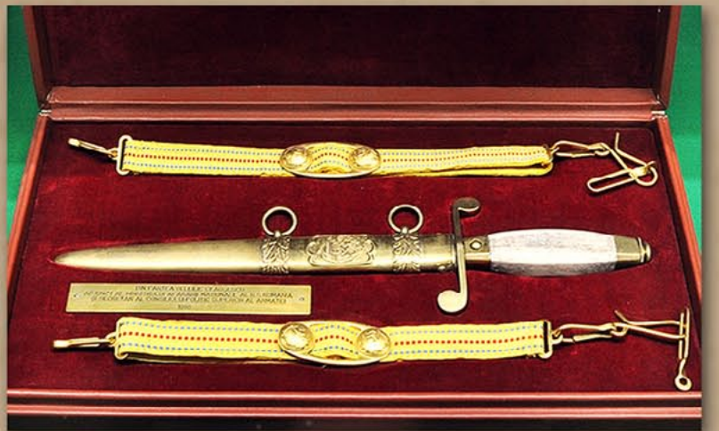
金短剑 罗马尼亚社会主义共和国民族保卫省副相兼 罗马尼亚军队最高政治理事会书记赠 1986年5月