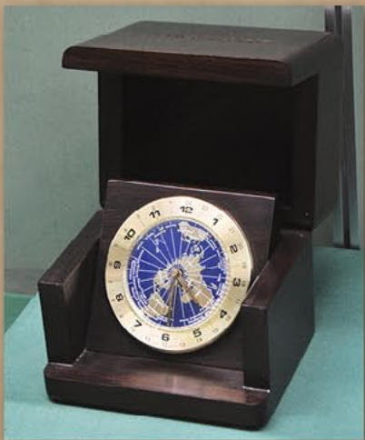
座钟 美国广播公司社长赠 1995年4月