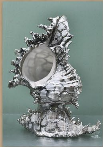
海螺台灯 菲律宾共和国国会议长赠 2006年4月