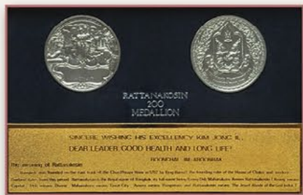
曼谷市形成200周年纪念章（泰国） 1982年11月24日