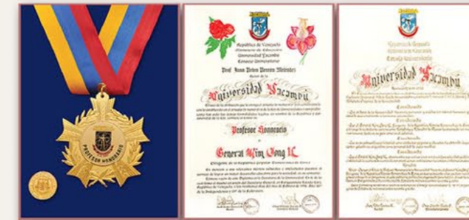
亚坎布大学名誉教授奖章、徽章、证书、决议（委内瑞拉） 1997年10月15日