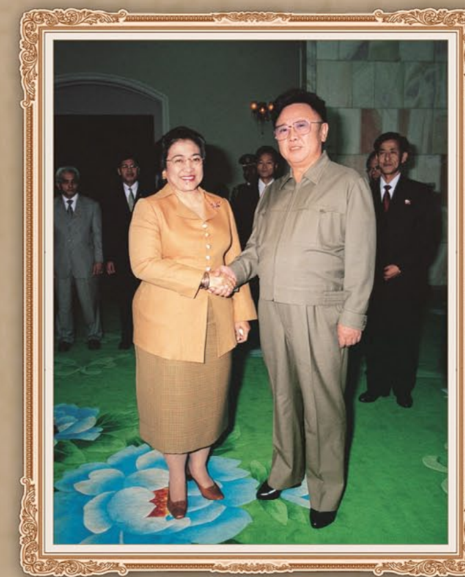
伟大领导者金正日同志会见印度尼西亚共和国总统梅加瓦蒂·苏加诺普特丽。2002年3月