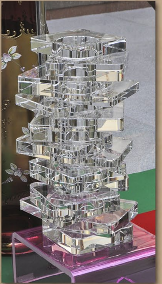
水晶花瓶 卡塔尔本·阿尔·谢克钢筋厂总厂长（印度人）赠 2009年2月