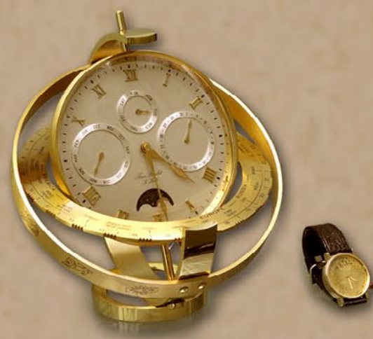
金质座钟、金质手表 瑞士日内瓦俱乐部代表团赠 1989年4月