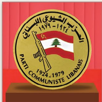
共产党成立55周年纪念章（黎巴嫩） 1980年10月10日