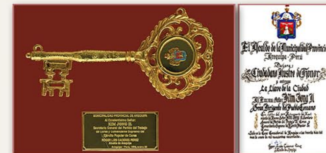
阿雷基帕市钥匙和名誉市民证书（秘鲁） 1998年1月30日