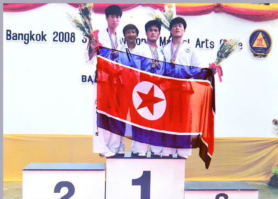
黄海北道跆拳道选手队选手参加第12届青少年及第7届老跆拳道世锦赛等国际比赛荣获冠军。

去年11月，在黄海北道沙里院市新建了跆拳道训练馆。这里具备跆拳道训练场、强体训练室、解乏室、体育信息室、体育科学技术普及室等。