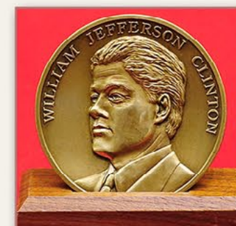
美利坚合众国第42代总统就职 仪式纪念章（美国） 1993年3月3日