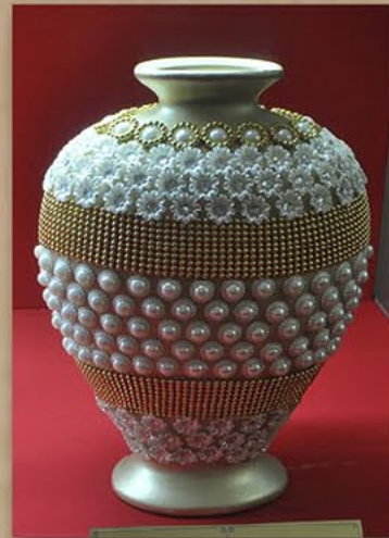
珍珠宝石镶嵌瓷花瓶 尼日利亚联邦共和国国会议员赠 2015年8月