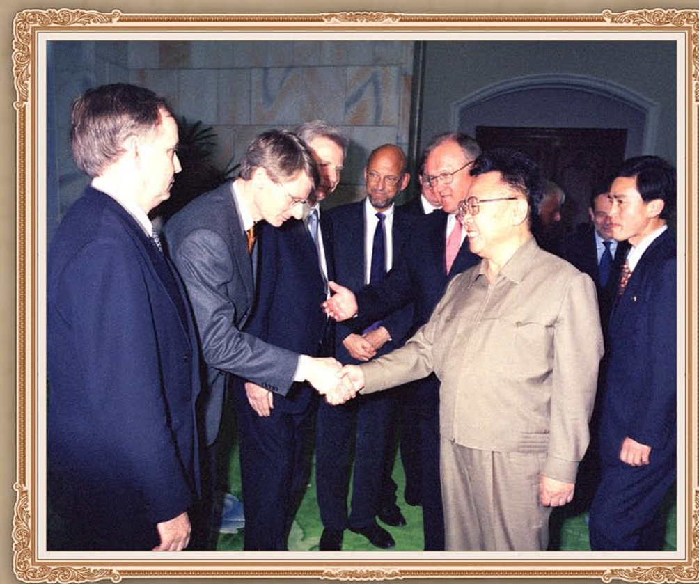
伟大领导者金正日同志会见欧盟最高级代表团成员。2001年5月