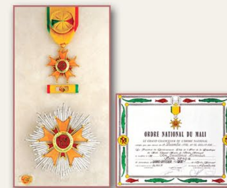
国家大军官十字勋章和证书（马里） 1992年12月17日