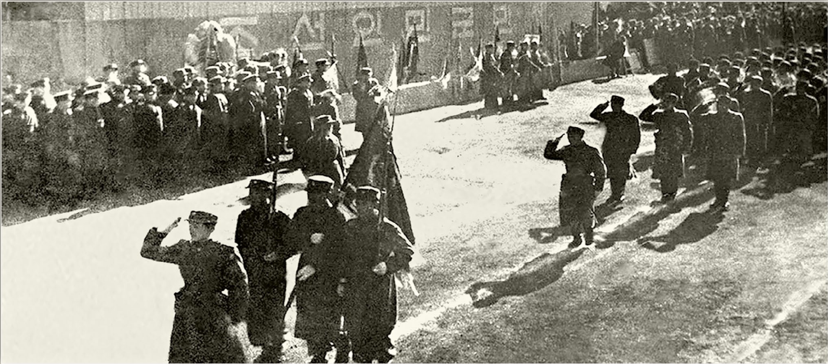
1948年2月8日，在平壤站广场（时称）举行第一个阅兵仪式，向世界宣布朝鲜人民军建立。