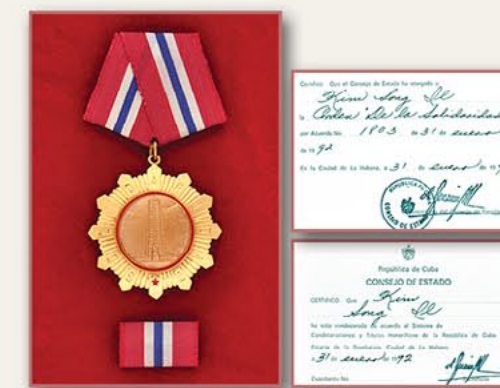
团结勋章和证书（古巴） 1992年1月31日