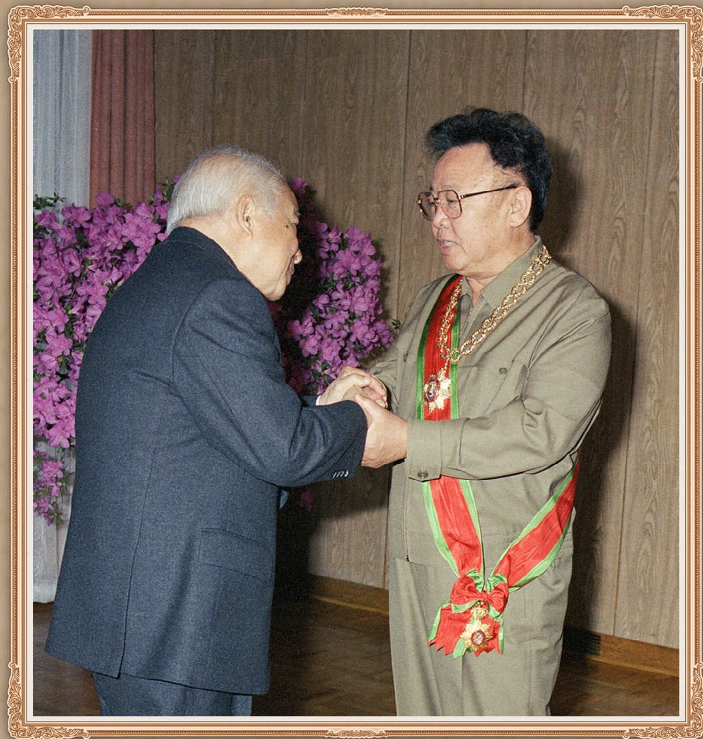
柬埔寨王国国王诺罗敦·西哈努克向伟大领导者金正日同志授予柬埔寨最高勋章。2004年7月