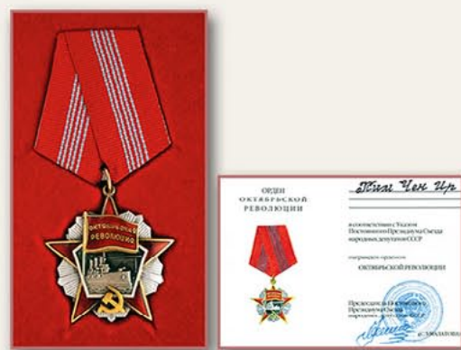
十月革命勋章和证书（俄罗斯） 1997年10月9日