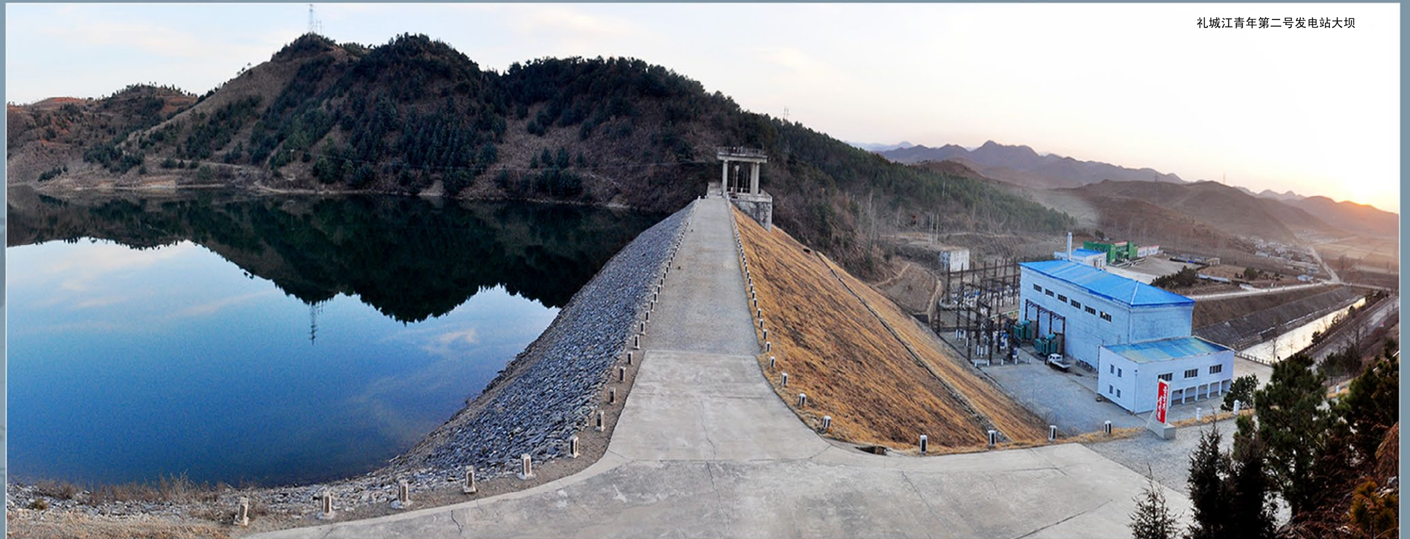
礼城江青年第二号发电站大坝