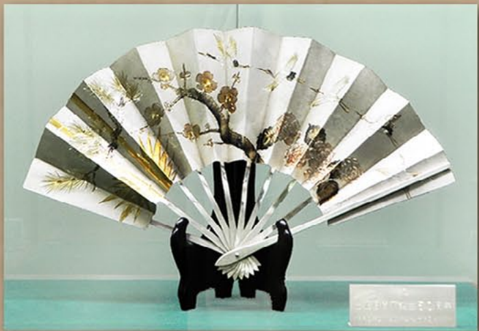
银工艺《扇子》 国际主体思想研究所赠 1992年2月