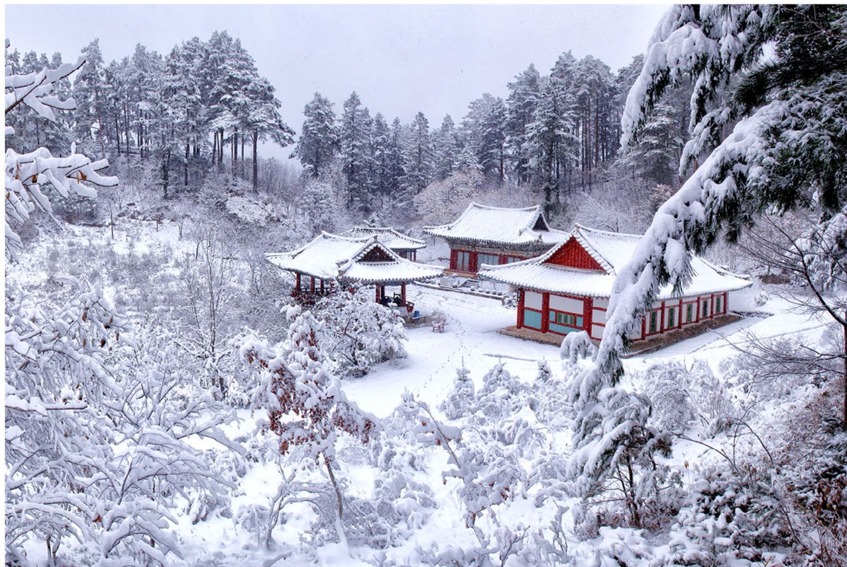
银装素裹的开心寺