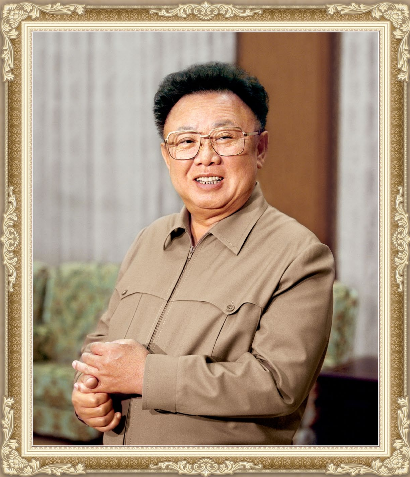
伟大领导者金正日同志