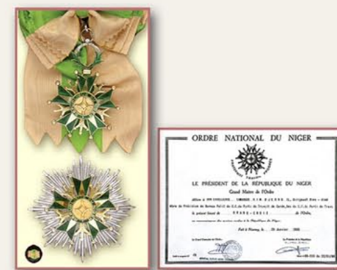
大十字国家勋章和证书（尼日尔） 1986年9月20日