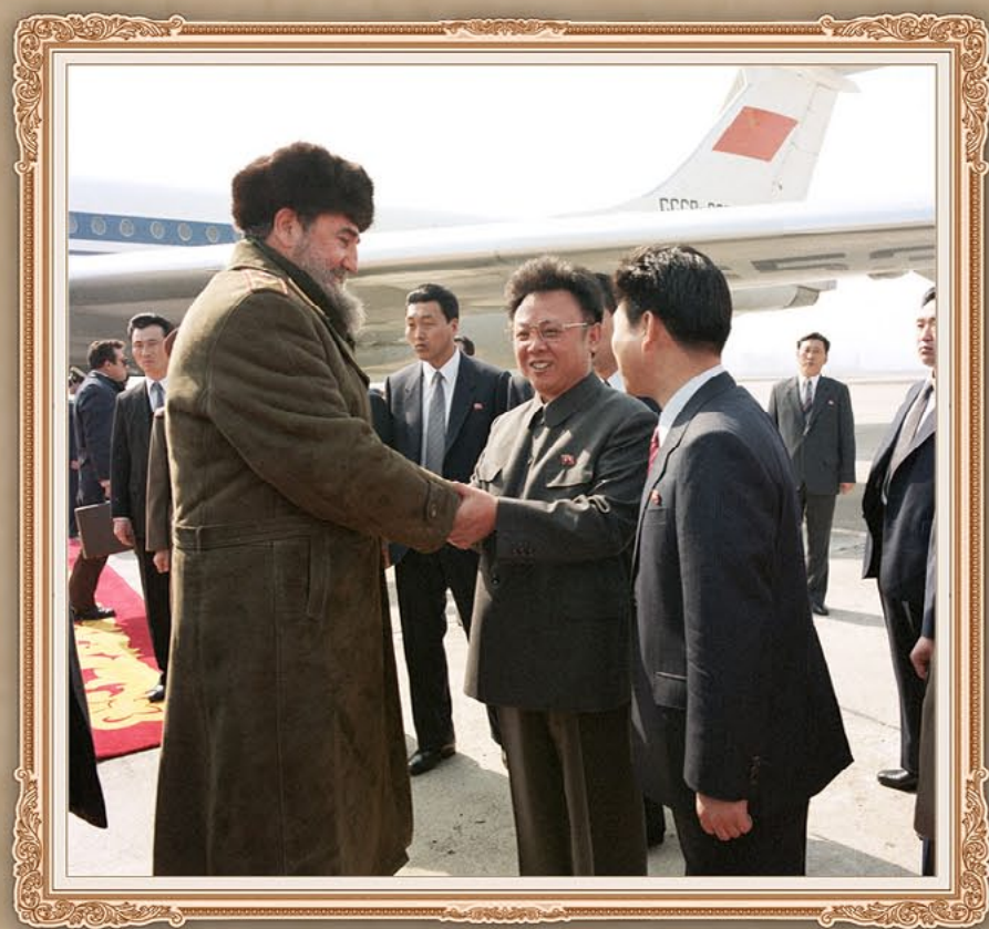
伟大领导者金正日同志和古巴共和国国务委员会主席菲德尔·卡斯特罗·鲁斯同志会晤。1986年3月