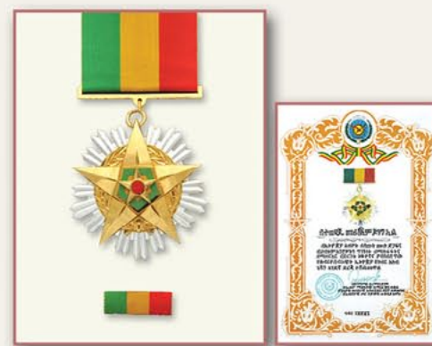
一级荣誉大星勋章和证书（埃塞俄比亚） 1985年11月16日