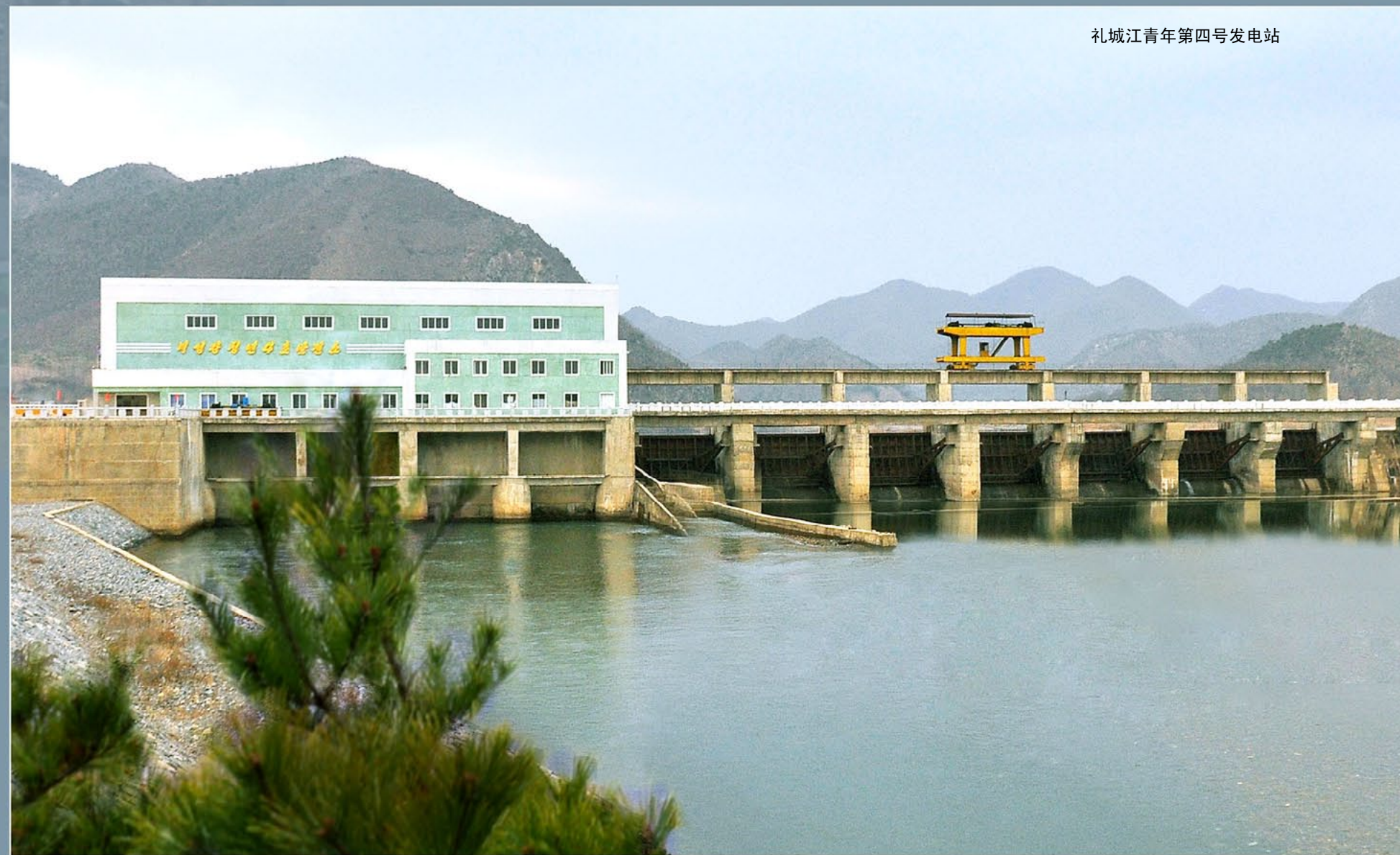
礼城江青年第四号发电站