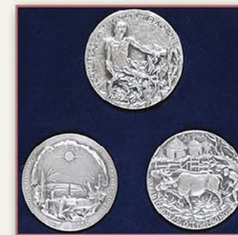
“世界粮食之日”纪念章 （联合国粮食及农业组织） 1983年9月9日