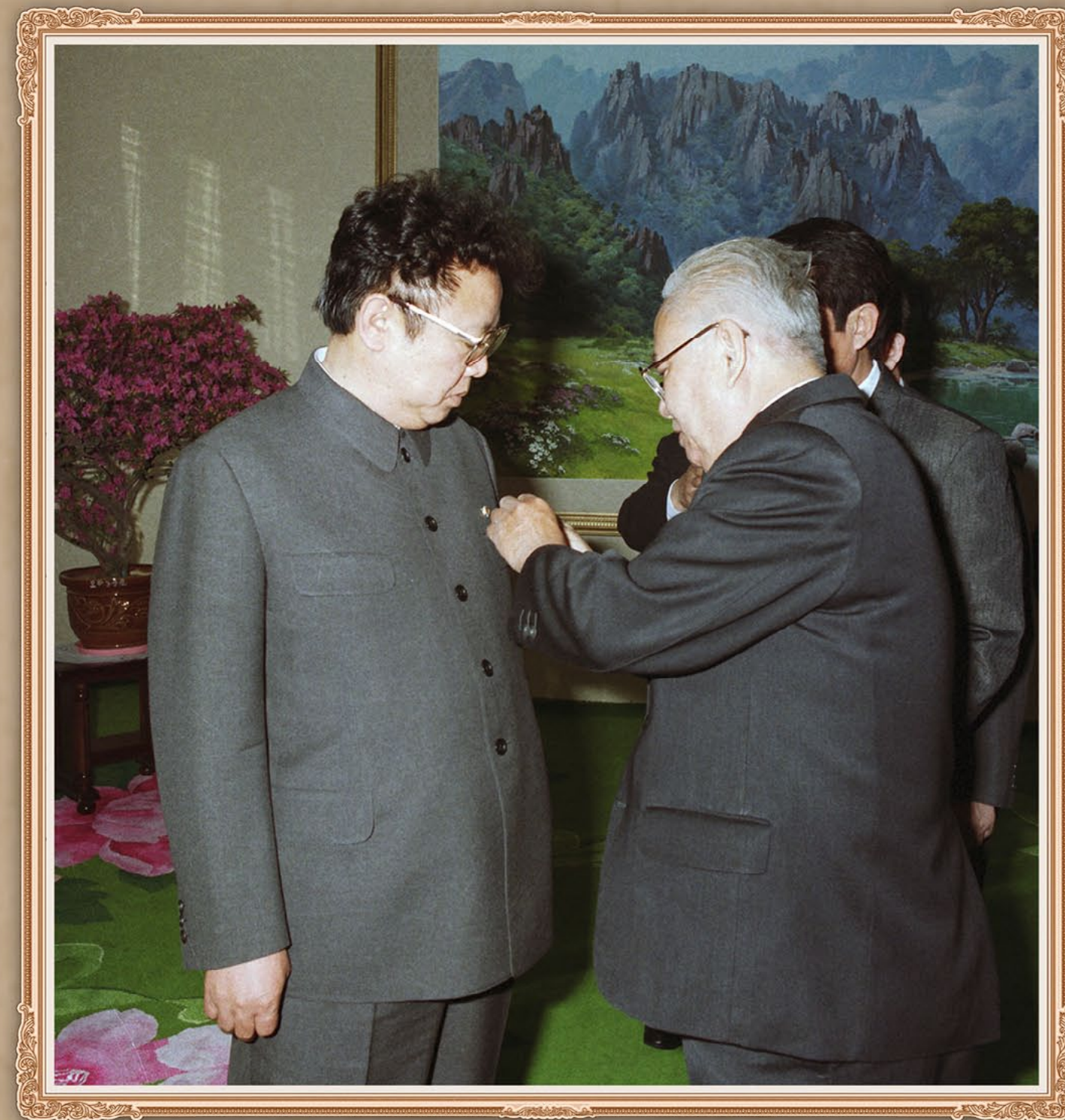
老挝人民民主共和国主席凯山·丰威汉向伟大领导者金正日同志授予老挝最高勋章。1992年4月