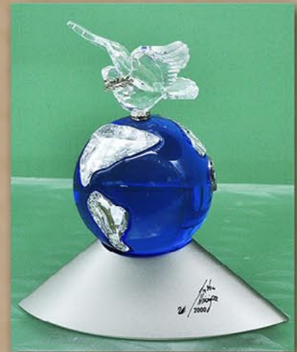
水晶工艺《和平的象征》 保加利亚festo代表团赠 2002年5月