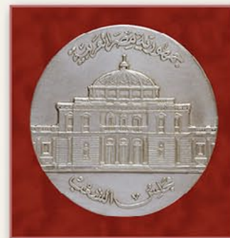
人民议会奖章（埃及） 1986年9月11日