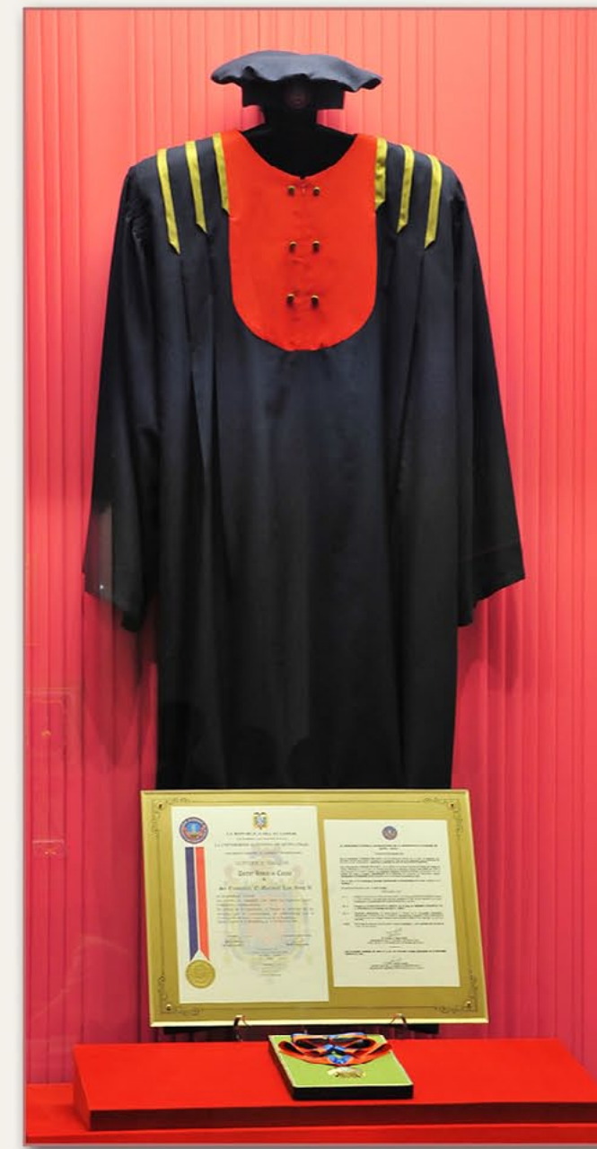
基多自治大学名誉博士证书、决议、 博士服、博士帽、奖章（厄瓜多尔） 2001年3月27日