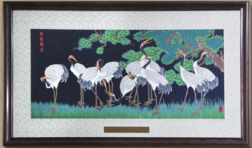
编织画《松龄鹤寿》 中共中央政治局常委兼国务院总理温家宝赠 2009年10月