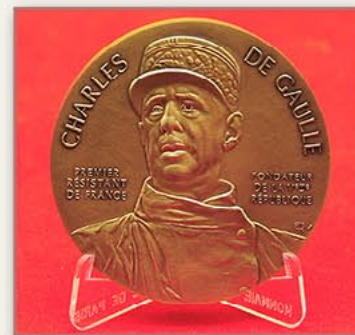
戴高乐生日100周年 纪念章（法国） 1990年10月6日