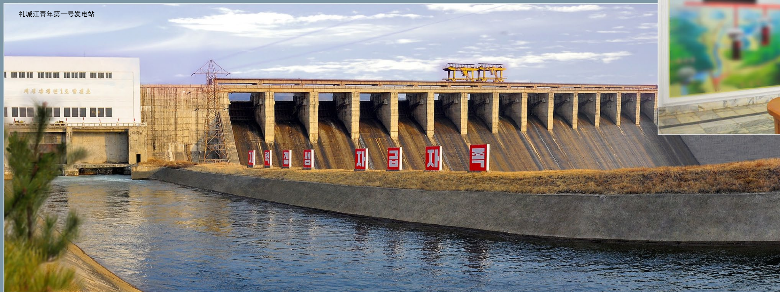
礼城江青年第一号发电站