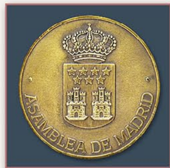
马德里市议会金质奖章 （西班牙） 1992年7月28日