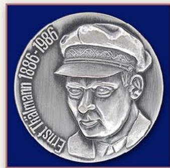
厄恩斯特·台尔曼生日100周年 纪念章（德国） 1985年8月24日