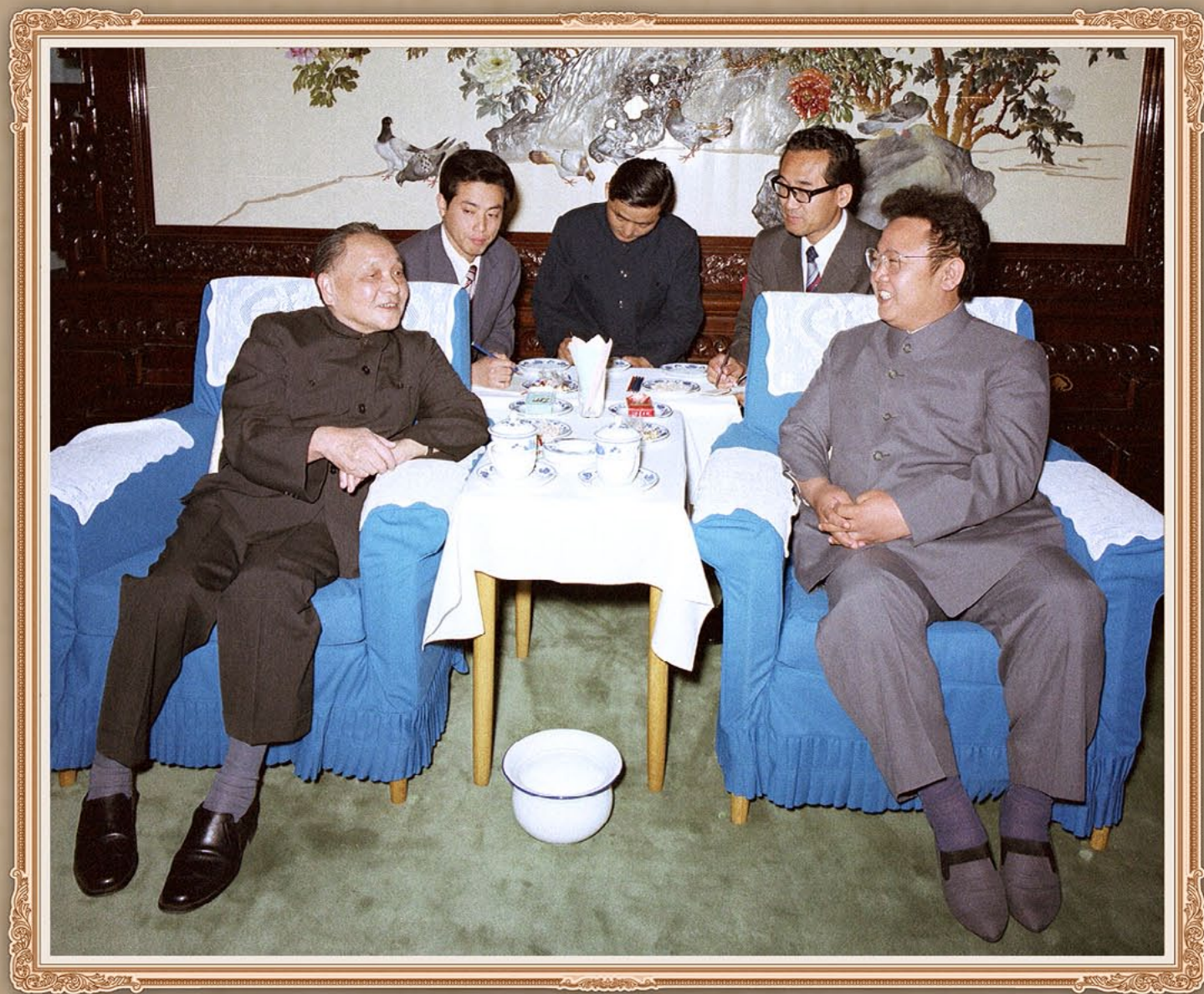
伟大领导者金正日同志和中国共产党中央顾问委员会主任邓小平同志亲切交谈。1983年6月