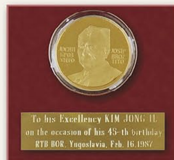
约瑟普·布罗兹·铁托 金质奖章（南斯拉夫） 1987年2月16日