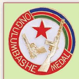
ONGULUMBASHE奖章 （纳米比亚） 1992年9月11日