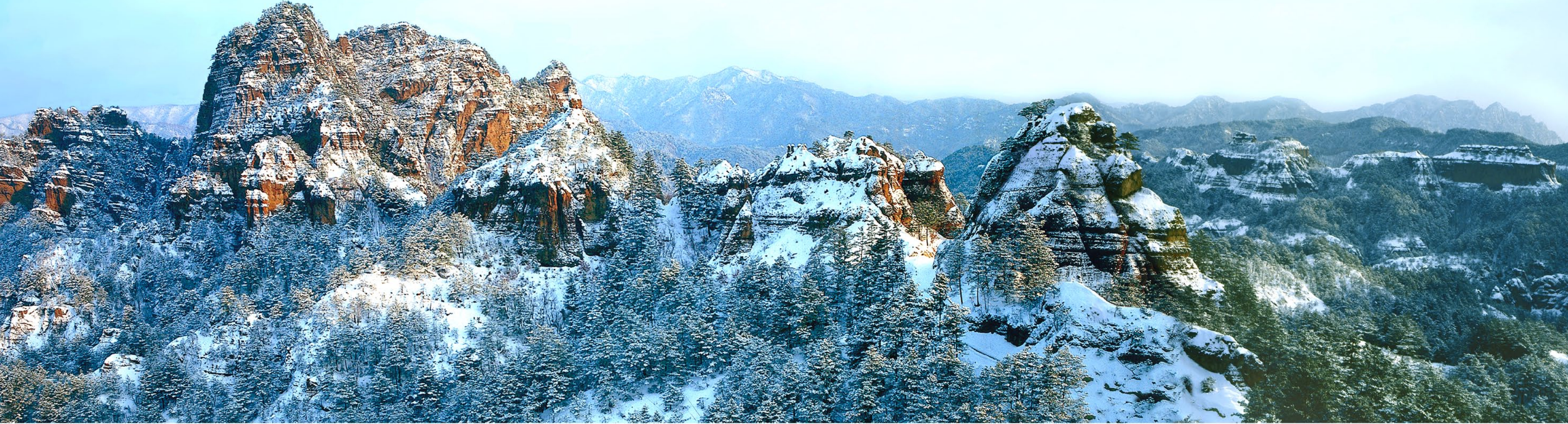
在升仙台眺望内七宝的“雪山”