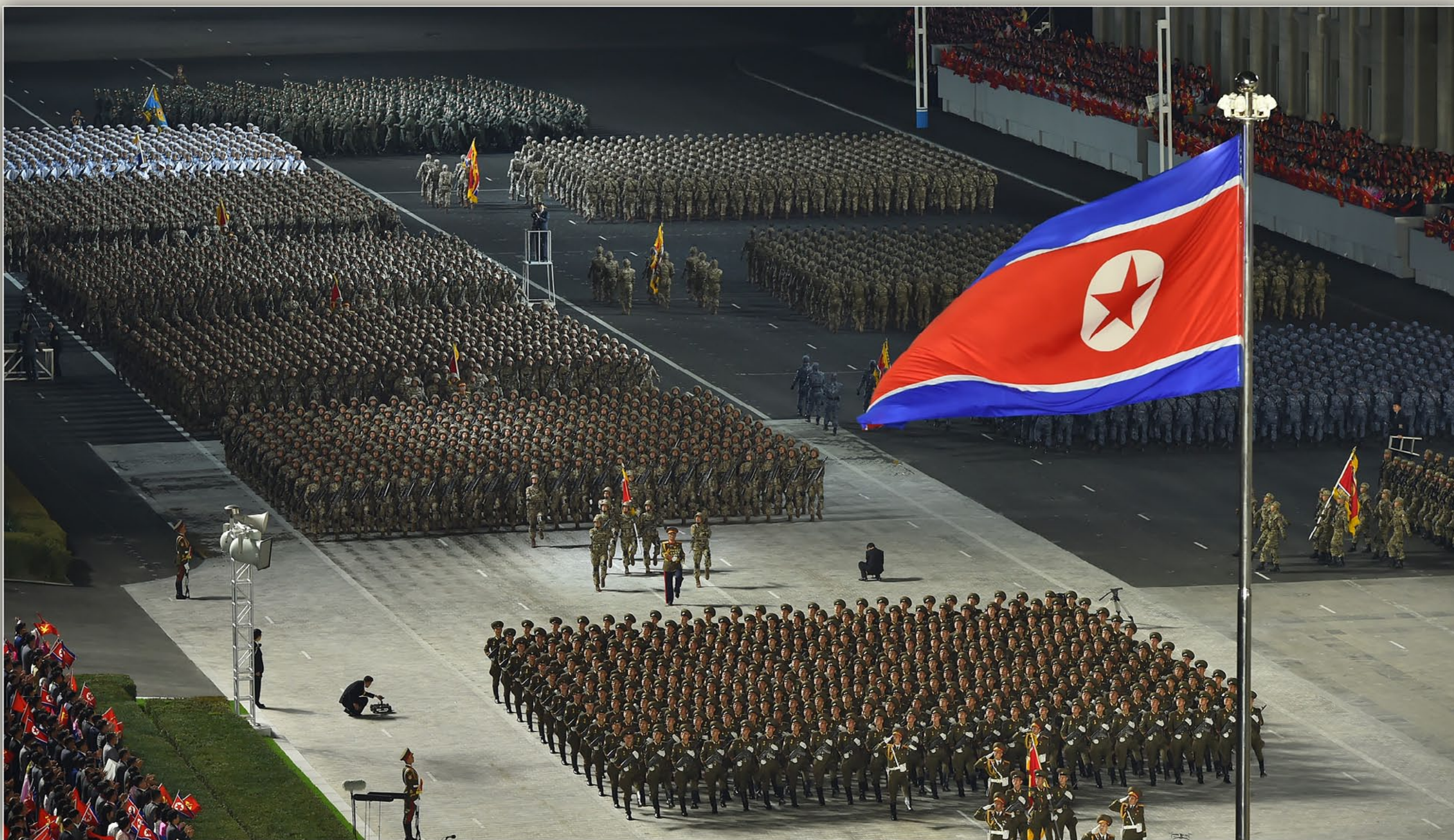
在朝鲜劳动党的领导下，朝鲜人民军加强成为牢固地捍卫国家主权和革命胜利果实的最精锐革命劲旅。