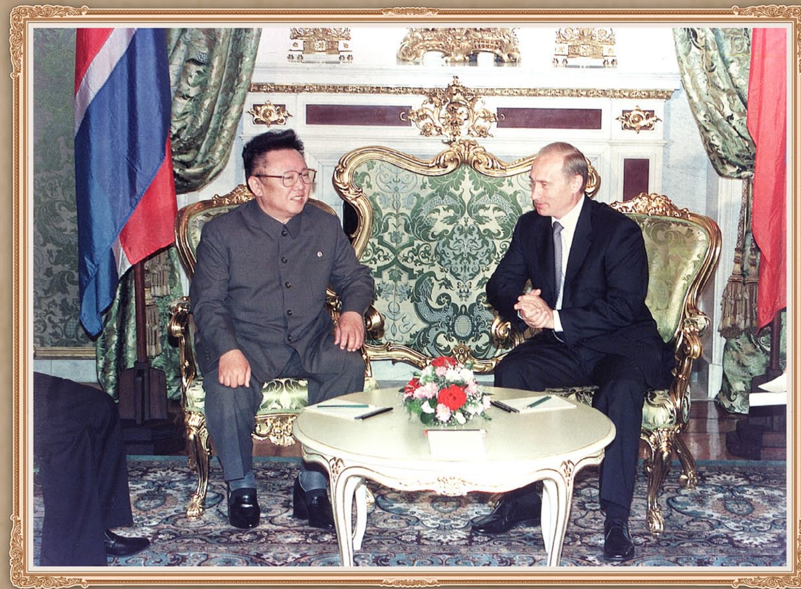
伟大领导者金正日同志和俄罗斯联邦总统弗·弗·普京同志进行会谈。2001年8月