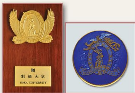
创价大学成立纪念章（日本） 1986年4月30日