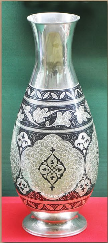
银质花瓶 俄罗斯联邦总统弗·弗·普京赠 2007年2月