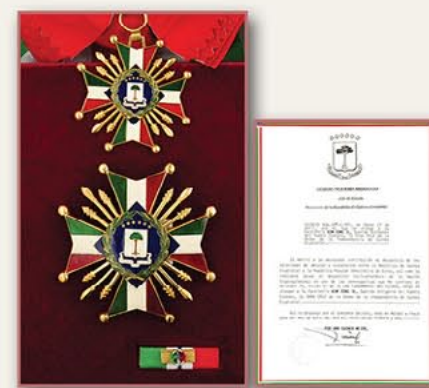
大十字独立勋章和政令（赤道几内亚） 1992年4月13日